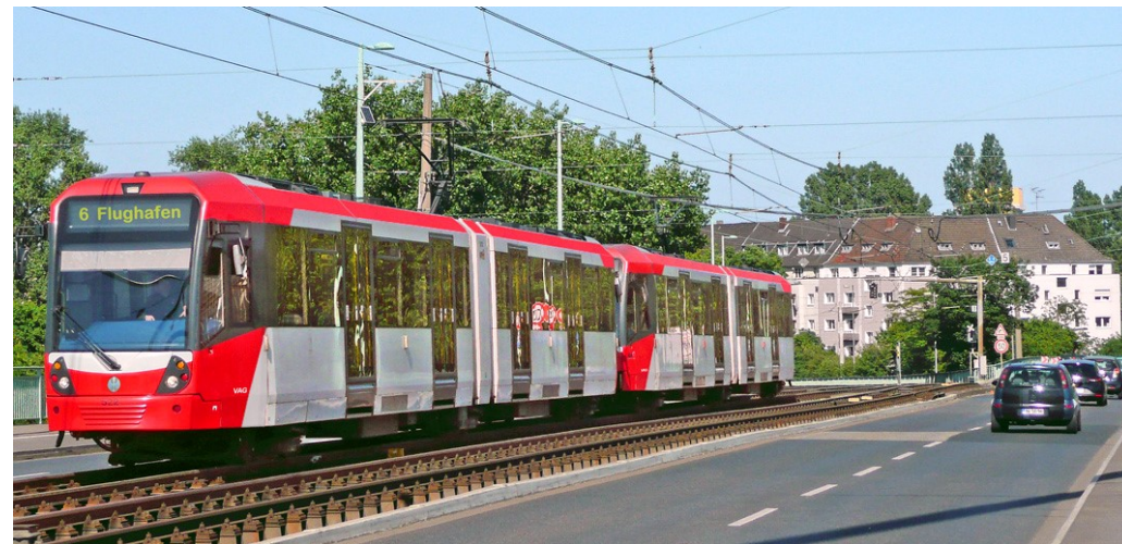
Fotomontage: So könnte eine Stadtbahn-Doppeltraktion aussehen.

86 % der Stadtbahnen (= 158 km Linienlänge) fahren im 10-Minuten-Takt und 14 % (= 26 km) im 20-Minuten-Takt. Die Abschnitte Plärrer - Weißer Turm und Lorenzkirche - Hauptbahnhof bieten mit vier Linien das häufigste Angebot und die dichtesten Zugfolge von 90 Sekunden gibt es westlich und südlich vom Plärrer, westlich vom Hauptbahnhof und südlich vom Rathenauplatz.